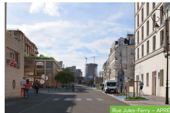
Rue Jules-Ferry – APRÈS

• Pour être informé sur l'avancée des chantiers, n'hésitez pas à contacter : quartier_charlebourg@nexity.fr