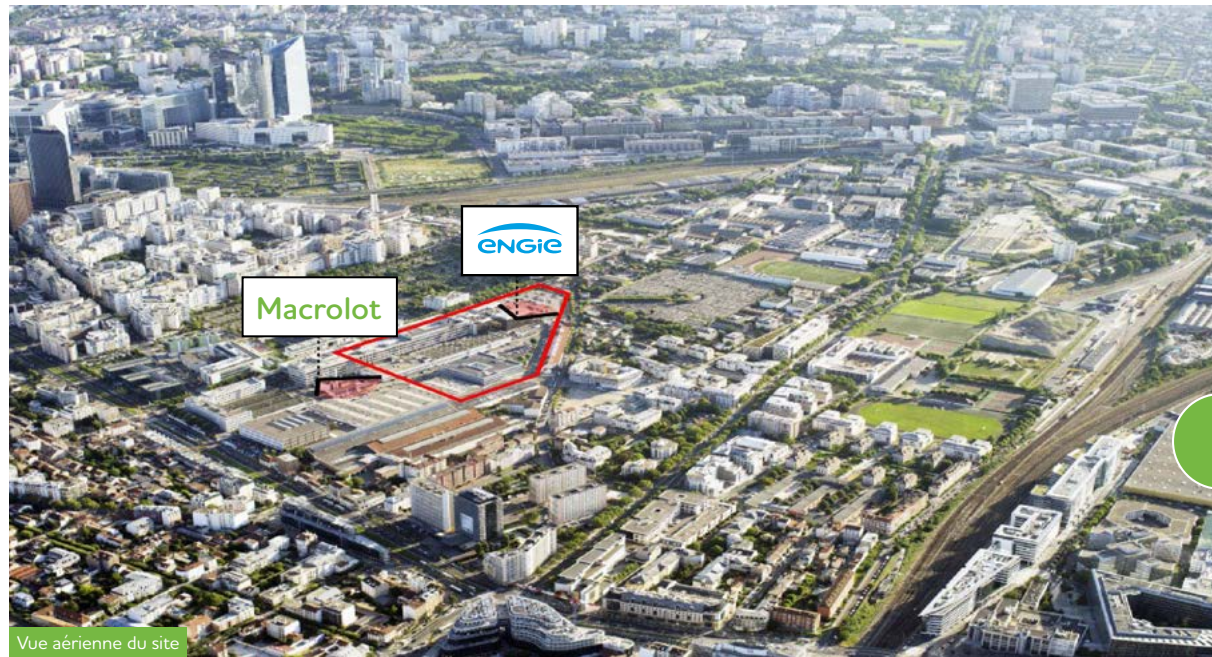
Vue aérienne du site

À l'entrée de la ville, le paysage urbain se transforme. Après avoir cessé son activité en 2018, l'ancienne usine PSA fait place nette pour accueillir dans les prochaines années un nouveau quartier plus mixte, plus vert... et plus ouvert.