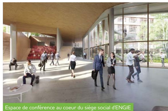
Espace de conférence au coeur du siège social d'ENGIE

Enfin, Paris La Défense aménagera les différents espaces publics, notamment le parc de deux hectares.