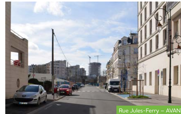
Rue Jules-Ferry – AVANT