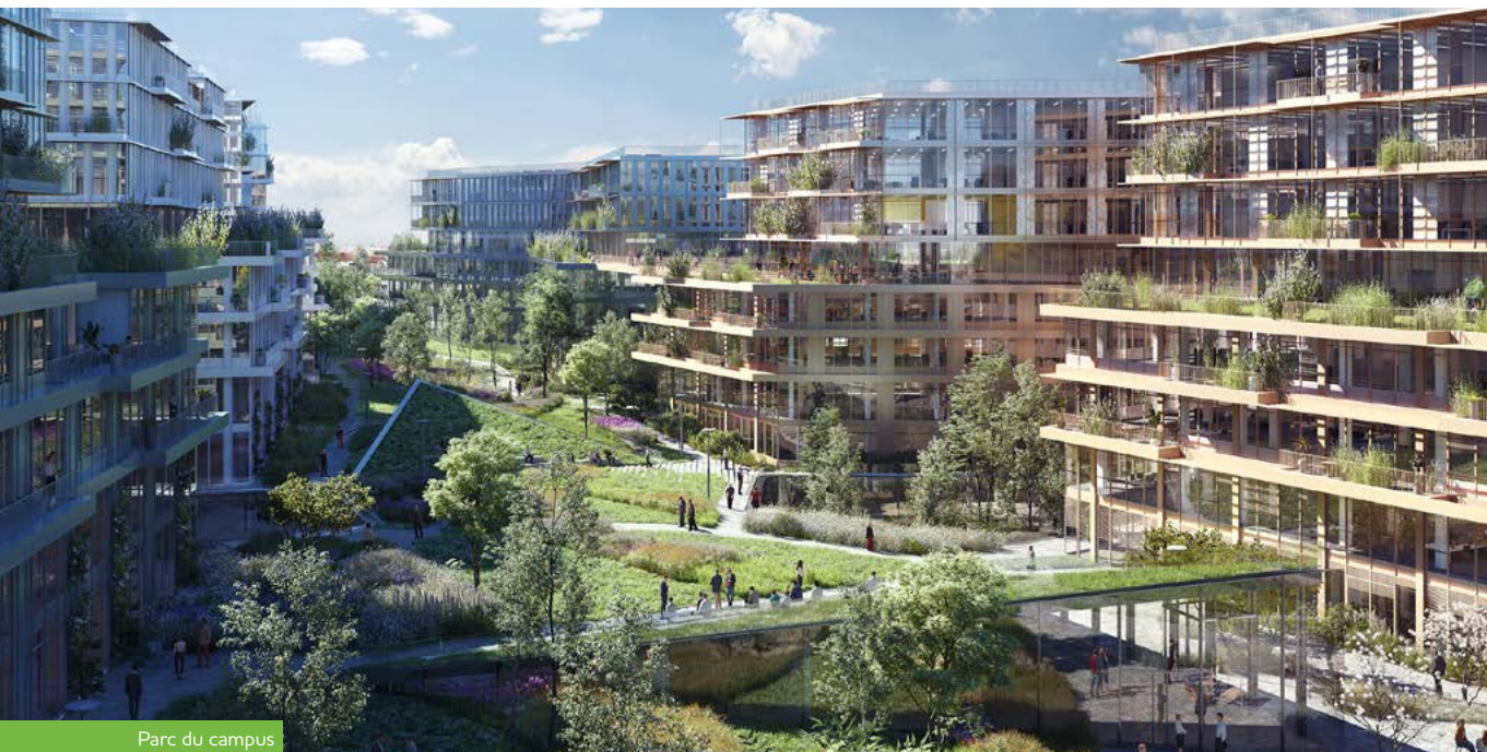
Parc du campus

Il y a quelques années, nos deux entreprises, ENGIE et NEXITY, se sont associées dans une aventure commune en acquérant, ensemble, les anciens ateliers PSA. Nous avons développé un projet urbain à haute exigence environnementale pour ce terrain sur lequel sera érigé le nouveau siège social d'ENGIE, vitrine des ambitions technologiques et écologiques du groupe, mais aussi des logements, commerces et équipements publics. C'est un véritable quartier de ville qui va bientôt remplacer cet ancien site industriel fermé.