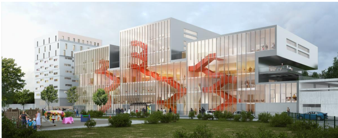
AASB_agence d'architecture suzel brout

Cette opération est conçue par l'agence d'architecture Suzel Brout.